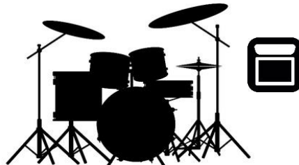
Drum + Sampler Roland SPD-SX